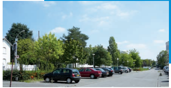
Rue de la Chicotière avant travaux